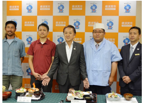
横須賀市長記者会見

第二海堡のある千葉県富津市や、上陸船の出る神奈川県横須賀市では、上陸ツアーの開催に合わせ、東京湾で採れる地魚を使って第二海堡に見立てた「海堡丼」の提供を始めました。また、とあるお店では、丸く握った寿司を大砲の弾に見立てた「手まり寿司」等も提供しています。上陸ツアーの中でこれらの新グルメを昼食として提供している他、横須賀名物「海軍カレー」付きのツアーも企画される等、地元の経済活性化に繋がっています。