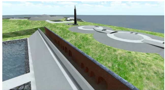
VRコンテンツのイメージ図

第二海堡上陸ツーリズムでも、この歴史的遺産の魅力を多くの方に伝えるべく、パンフレットの多言語化や、スマホをかざすと当時の島の姿がよみがえるVR・ARコンテンツの開発を検討しており、令和元年度中に実施する予定です。